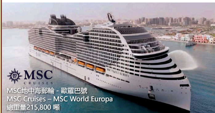
MSC地中海郵輪 - 歐羅巴號 MSC Cruises - MSC World Europa 總重量215,800 噸