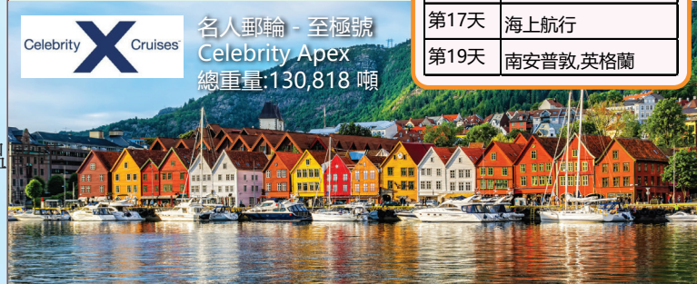
名人郵輪 - 全極號 Celebrity Apex 總重量: 130,818 噸