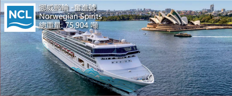
挪威郵輪 - 奮進號 Norwegian Spirit 總重量: 75,904 噸