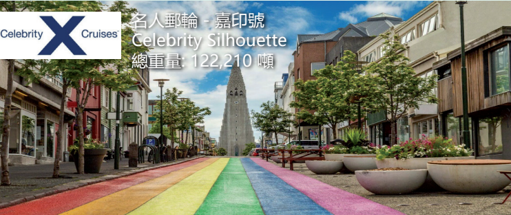
名人郵輪 - 嘉印號 Celebrity Silhouette 總重量: 122,210 噸