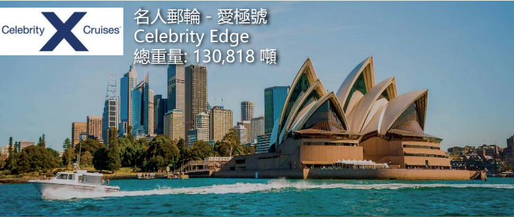
名人郵輪 - 愛極號 Celebrity Edge 總重量: 130,818 噸